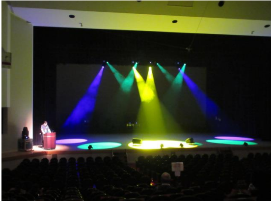
照明の説明(ムービングスポットライト)