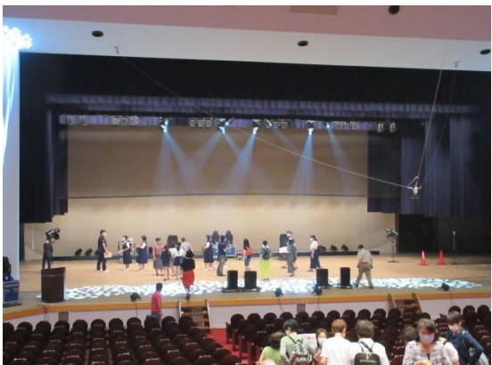
舞台、楽屋の見学の様子1