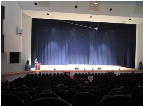
舞台設備の説明(割幕について)