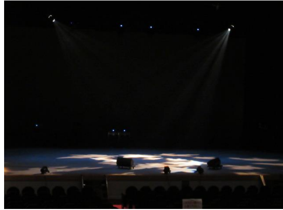
照明の説明(カッターライト)