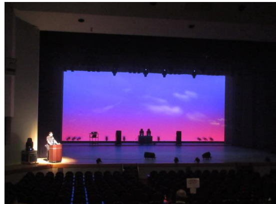
照明の説明(流れ雲)