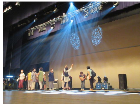
舞台、楽屋の見学の様子2