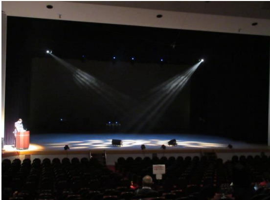
照明の説明(カッターライト2)