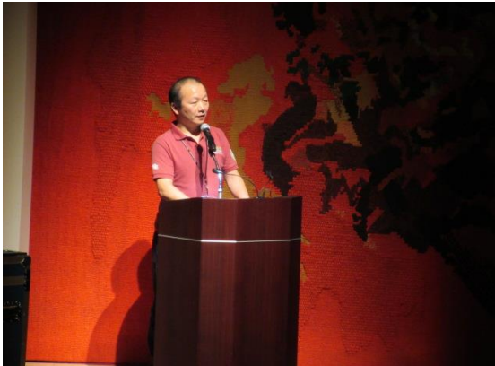
改修工事に関する説明